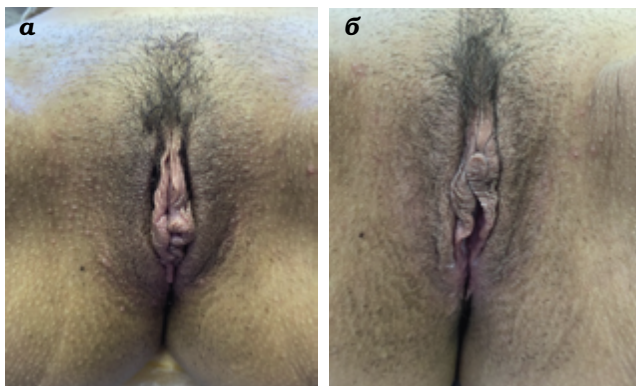
Рис. 5. Пациентка О., 42 года. Омоложение интимной зоны. Вид до (а) и после 8 процедур омоложения препаратами Dermotime (б)

Синергетическое воздействие в одном протоколе 2 пилингов с концентрированными фруктовыми кислотами (50%-ной L-аскорбиновой + 80%-ной молочной), омолаживающим концентратом с факторами роста и инкапсулированным 5%-ным ретинолом оказывает мощный антивозрастной эффект, обновляя и регенерируя кожу (рис. 5).