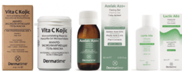
Рис. 2. Препараты для интимного пилинга Dermitime (Испания)