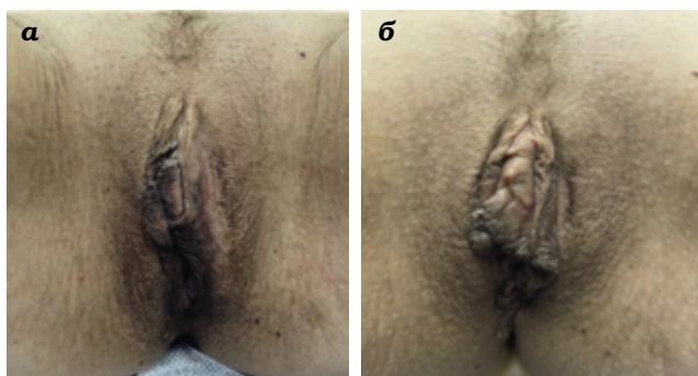
Рис. 4. Пациентка Л., 40 лет. Гиперпигментация в интимной зоне. Вид до (а) и после 4 процедур осветления препаратами Dermatime (б)

Результаты, представленные на рис. 4, сделаны с промежутком 40 дней.